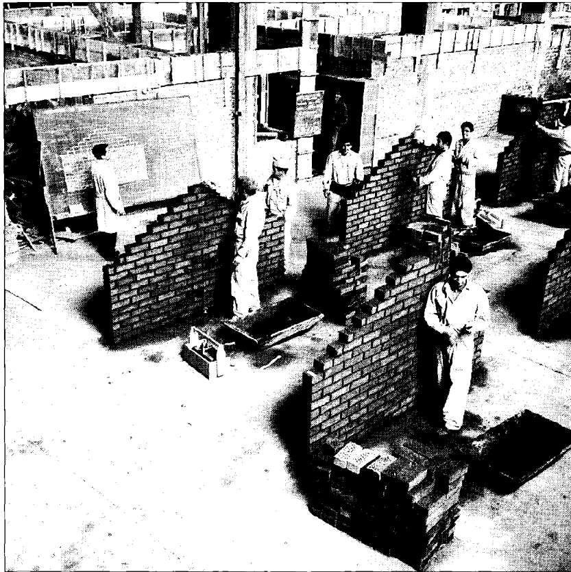
Escuela de albañiles, vista por Luis Ladrón de Guevara.

“He recorrido el país desde el norte hasta Punta Arenas”, comenta el fotógrafo, quien dedicó el último tiempo a escarbar en su archivo para elegir las imágenes