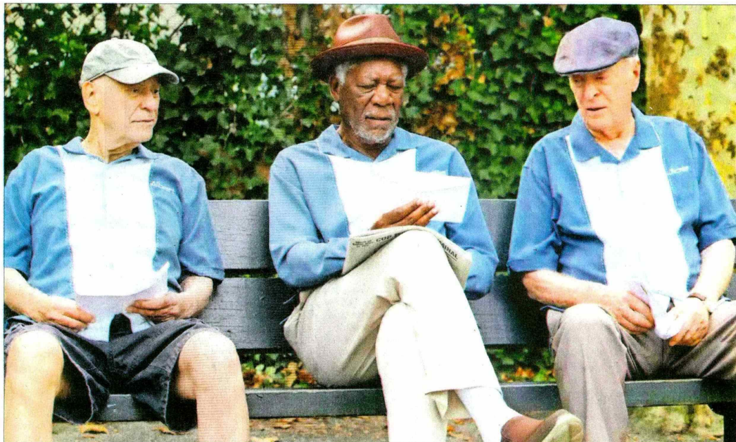
Los protagonistas de la película “Un golpe con estilo”, Alan Arkin, Morgan Freeman y Michael Caine, son todos ganadores del Oscar.

“Un golpe con estilo” debuta mañana en la cartelera local, y está protagonizada por Michael Caine, Morgan Freeman y Alan Arkin.